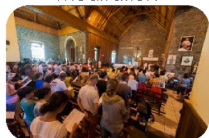
Prière, confession, adoration