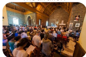
Prière, confession, adoration