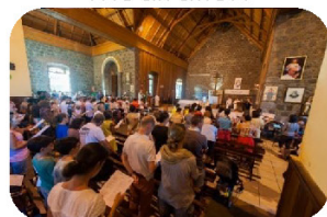
Prière, confession, adoration